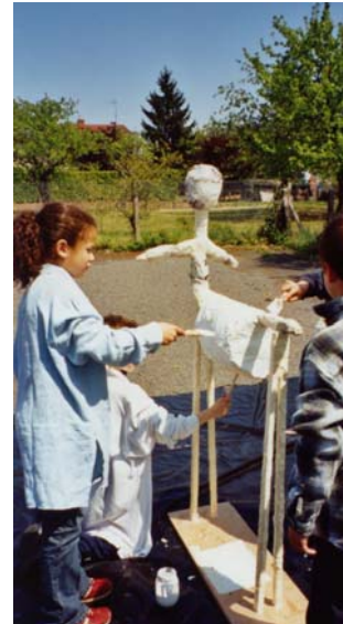
La fabrication d'un centaure